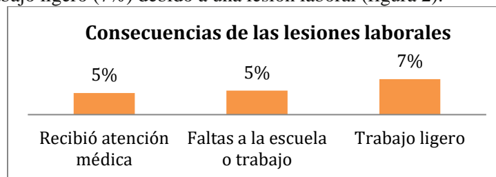
Figura 2. Consecuencias de lesiones laborales reportadas por trabajadores agrícolas infantiles.